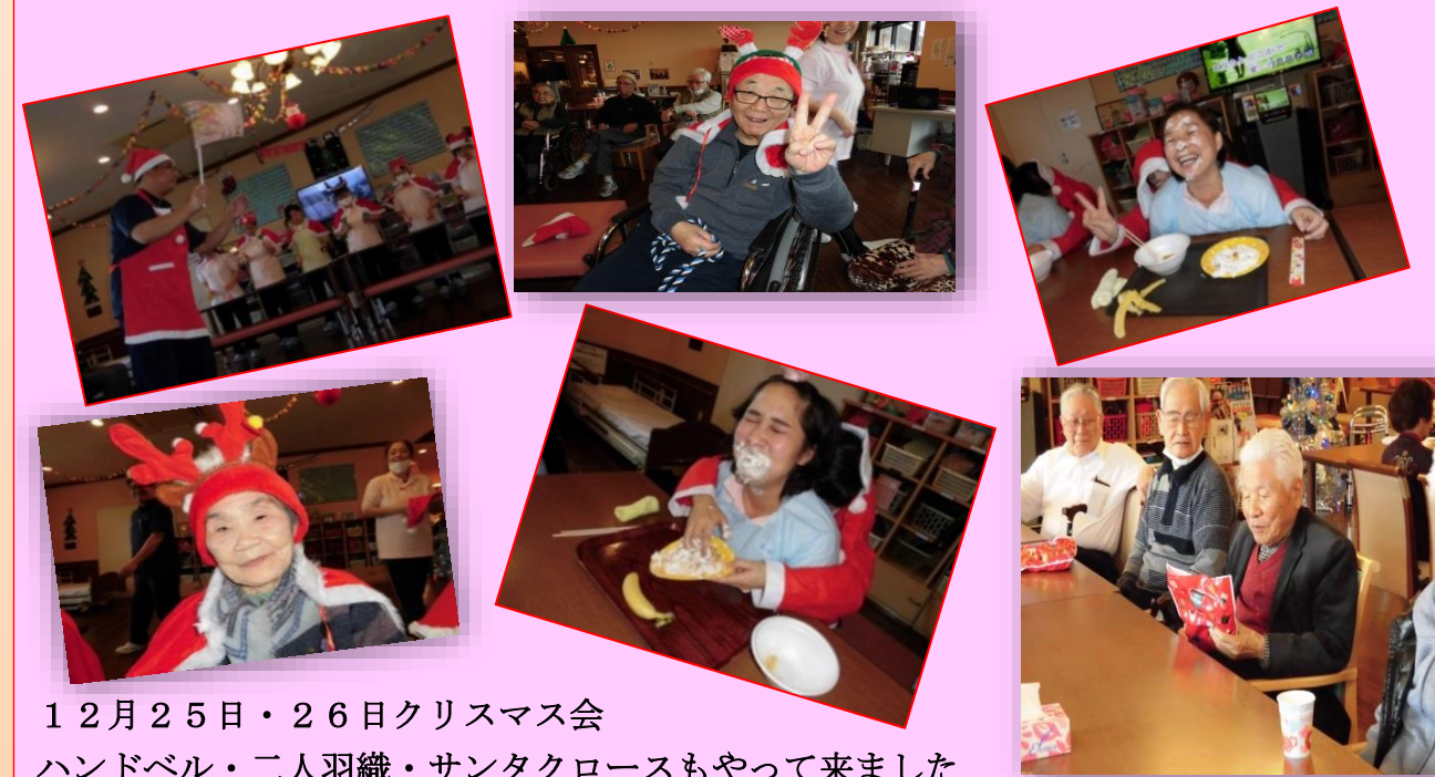
12月25日・26日クリスマス会 ハンドベル・二人羽織・サンタクロースもやって来ました