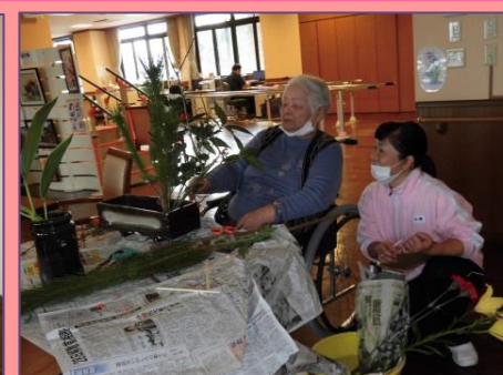
正月用に生け花。学ぶスタッフも真剣です 松竹梅・南天・千両・葉牡丹・・・奥が深い