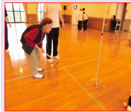
5月17日(木)グランドゴルフ大会 6階レクリエーションホールはかなり広く、歩行も大変でした。