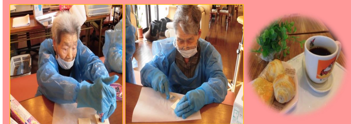
5月26日(土) あんこパイとチョコパイを作りました。お菓子作りが楽しくなり、次のおやつは何を作ろうか話題となりました。