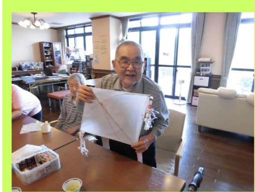
自宅で旗を作りました。 「絵を描いてくれんですか〜」