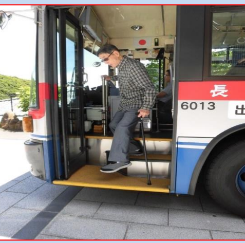
病院受診や買い物でバスを利用する際、一段一段に時間がかかり、杖や傘、両手に荷物で気持ちも焦りますね。 シンフォニー稲佐の森Ⅱは始発の為、長崎バス様の御協力のもと乗降訓練もしています。