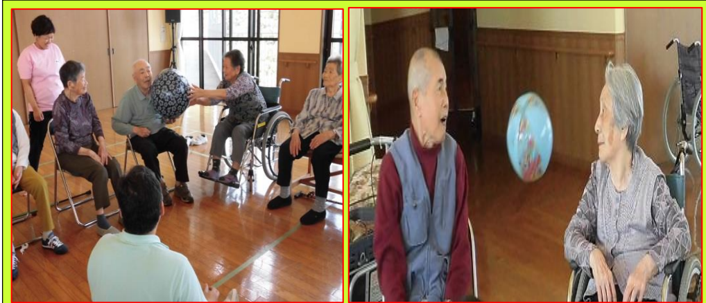
5月24日(木) 球技大会 風船バレーの戦いが、お互いボールの譲り合い！