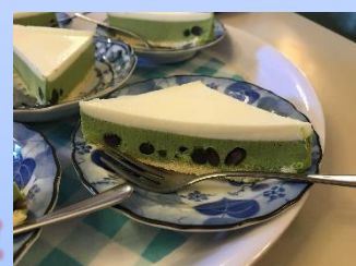
抹茶のレアチーズケーキ