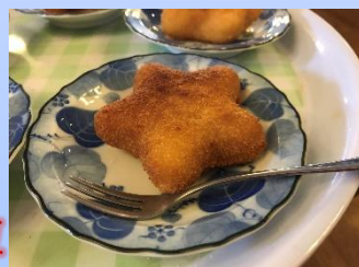
揚げたて星のコロッケ