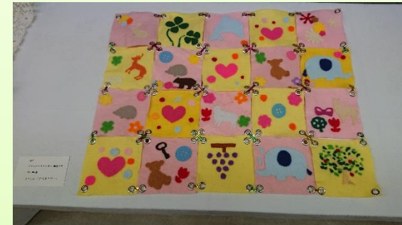
ニードルフェルト

先月お伝え出来なかった9月中旬に開催された「シルバー作品展」。以前途中経過をお伝えしていた「ニードルフェルト」をデイサービスの全体作品として出展し、利用者様個人の作品を出展してまいりました。すでに次の作品展に向けて新たな製作に取り組んでおりますので随時お伝えしてまいります(*^-*)