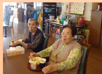
美味しい顔のお手本です