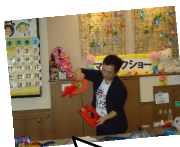
レコードの色を変えるマジック中(´Д`)

8月28日(水)にマジシャンの方が来て下さりマジックショーを披露してくださいました！間近で見るマジックに皆様驚かれ、大好評でした(*~艸~)