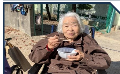
作品や餅つきを見学し美味しいぜんざいも頂いてきました(*^-^*)

4年ぶりに川棚町総合文化祭や小串郷自治会産業祭の見物に出掛けました。他の作品を見て次の文化祭に向けて創作意欲が高まりました。