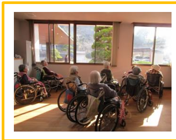
鬼火の炭で焼いたお餅を食べていただきました。