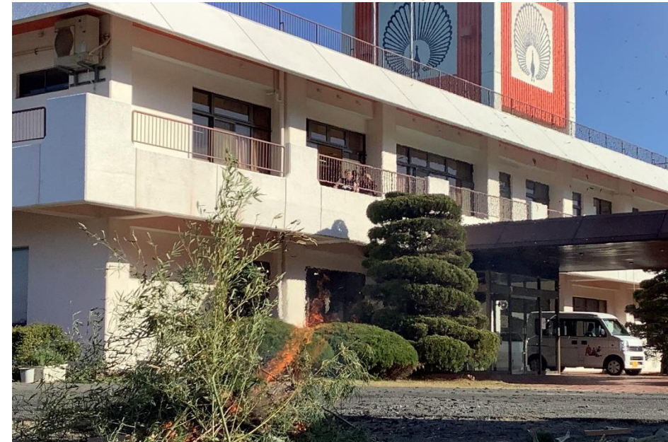
無病息災を願い鬼火焚き 1/6