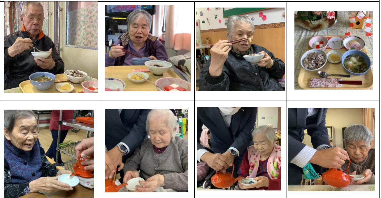
元旦の様子です。お屠蘇と祝膳で令和6年が幸多き事を祈りました。