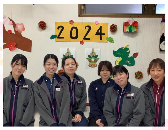
新しいスタッフで頑張ります